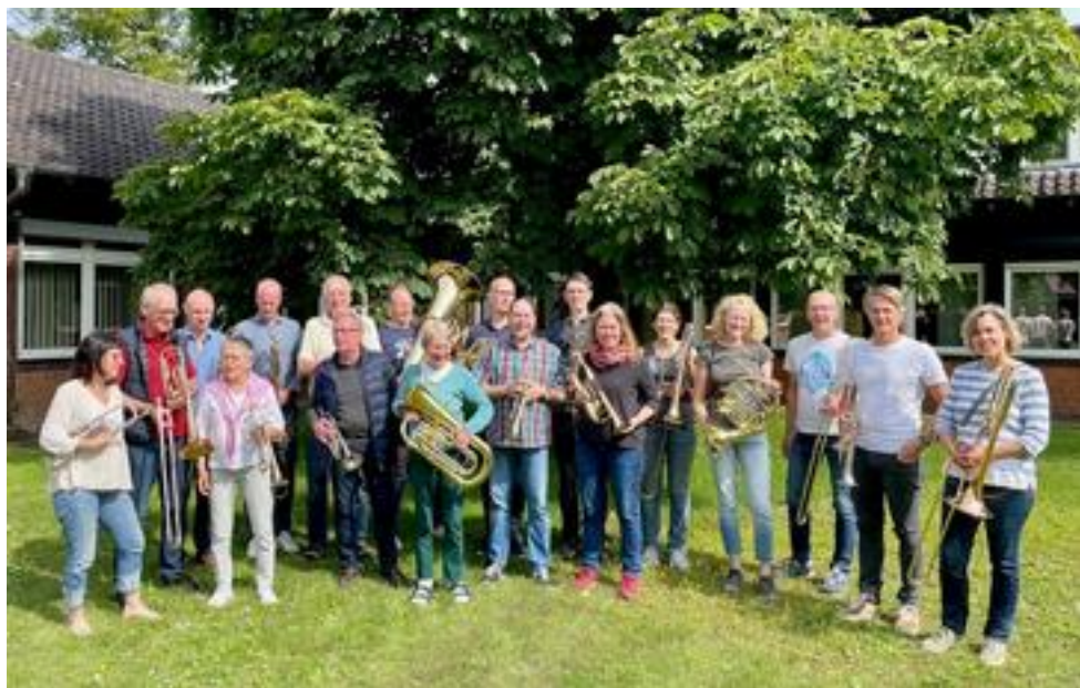
Bläserensemble an der Apostelkirche Münster, 22 Mitwirkende