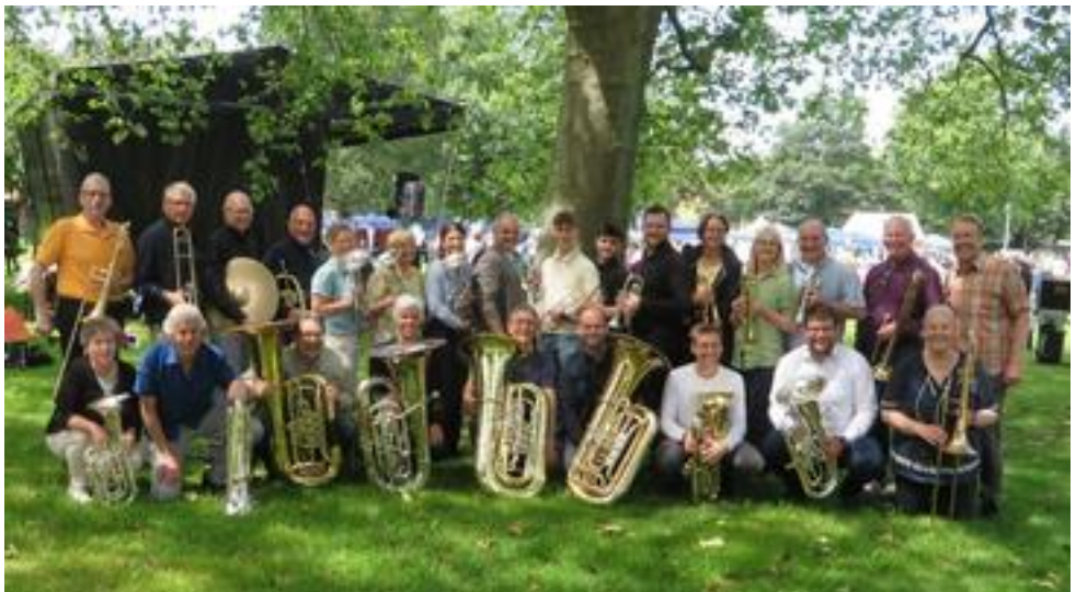
Brass für Spass, Geilenkirchen, 25 Mitwirkende