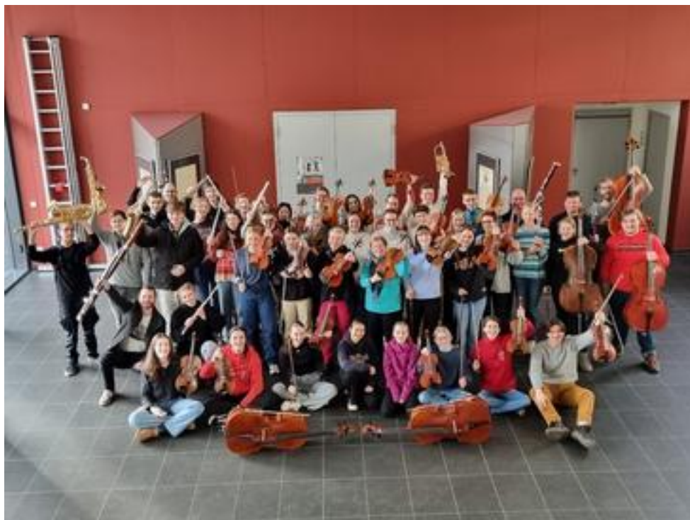
Sinfonieorchester der Musikschule der Stadt Mülheim an der Ruhr, 61 Mitwirkende