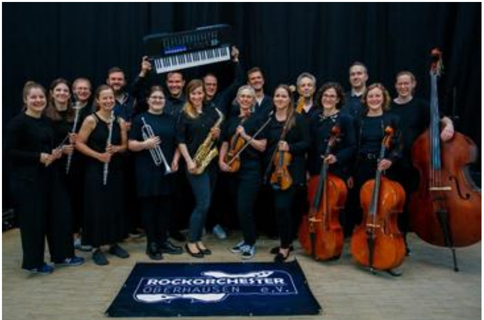
Rockorchester Oberhausen, 27 Mitwirkende