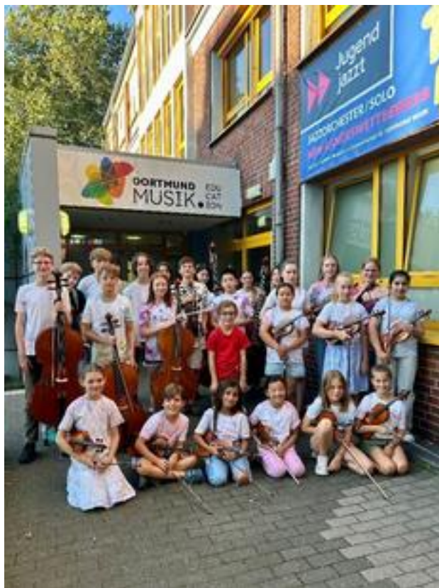
DOKIO (Dortmunder Kinderorchester), 30 Mitwirkende