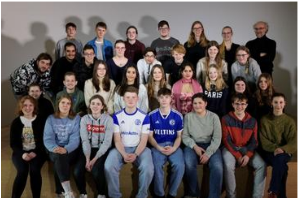
Städtisches Blasorchester Hamm, 50 Mitwirkende