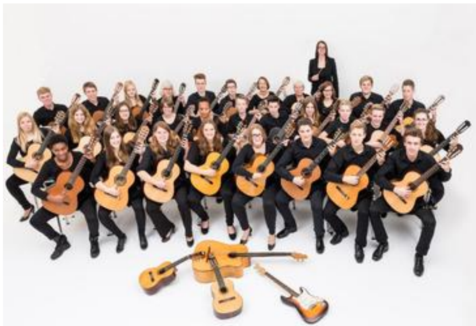
Gitarrenensemble Rheine 1983 e.V., 16 Mitwirkende