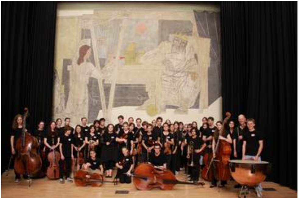
Clara-Schumann-Players, Düsseldorf, 45 Mitwirkende