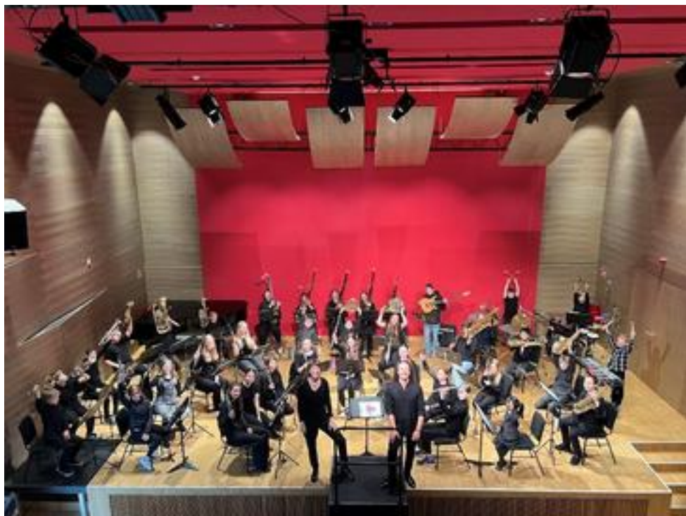
WINDorchester der Bernd-Alos-Zimmermann-Musikschule Erfstadt, 42 Mitwirkende