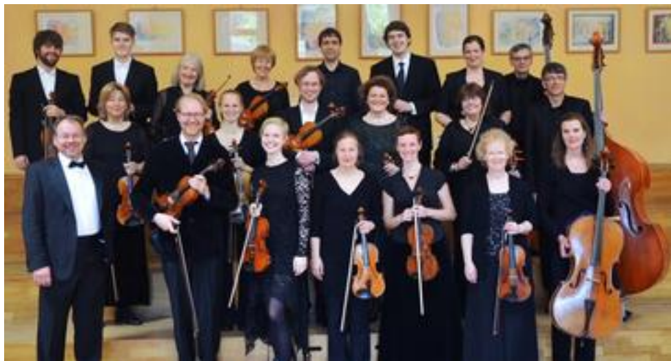
Instrumentalensemble der Wittener Musik Akademie, 16 Mitwirkende

Streichquartett d-moll D 810 "Der Tod und das Mädchen" Allegro Andante con moto