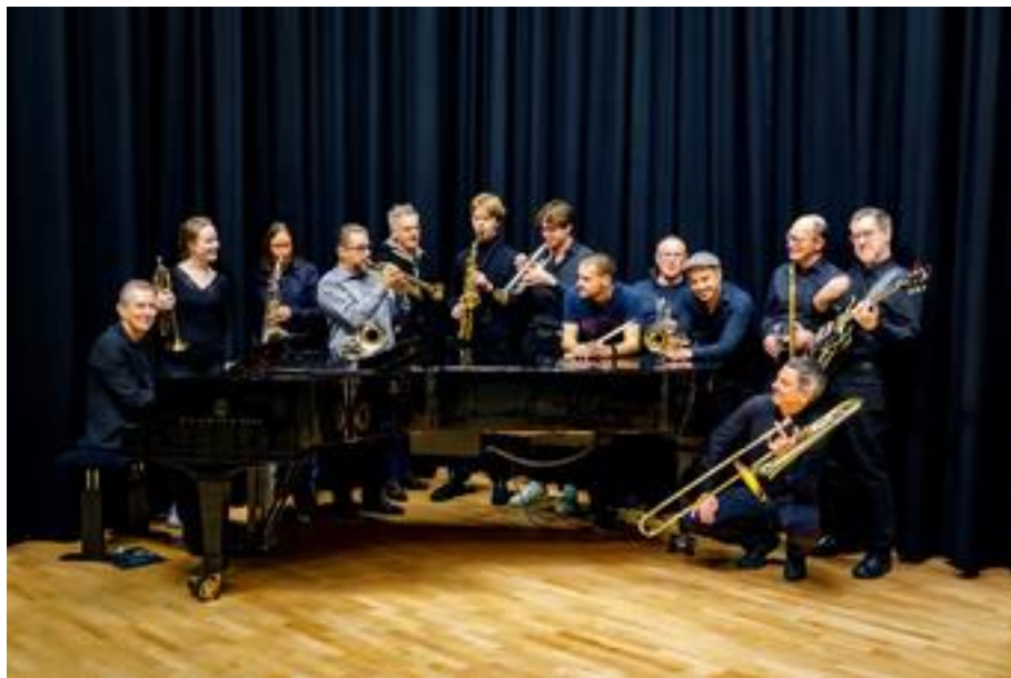
Big Band der Clara-Schumann-Musikschule Düsseldorf, 18 Mitwirkende